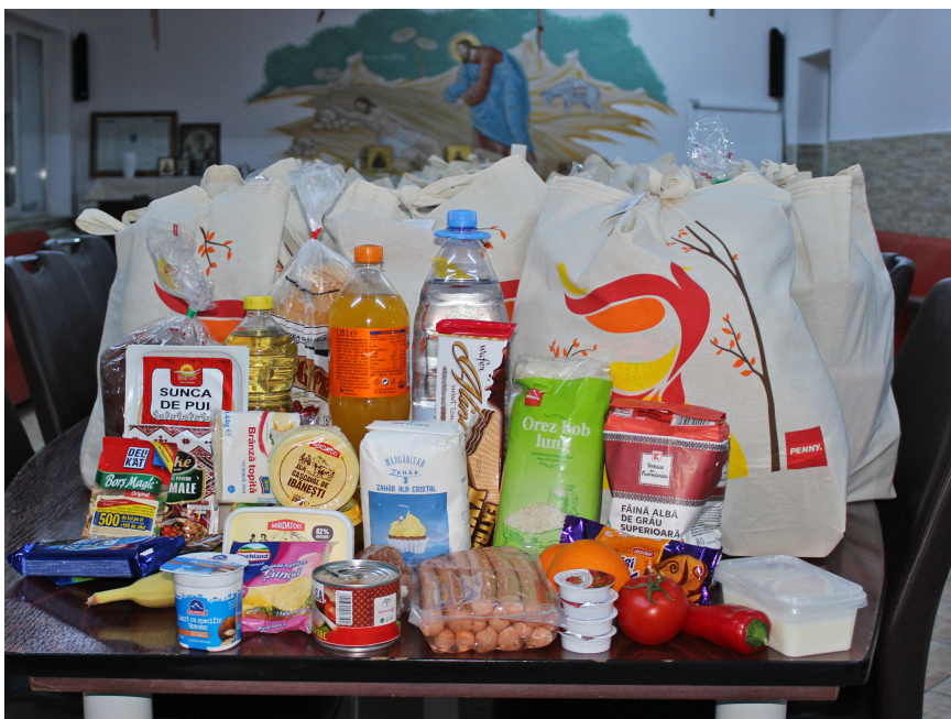
Zu Weihnachten erhielten mehrere hundert bedürftige Familien vom Verein Pro Sighisoara gesponserte Lebensmittelpakete, die Freude am Fest der Liebe bescherten.