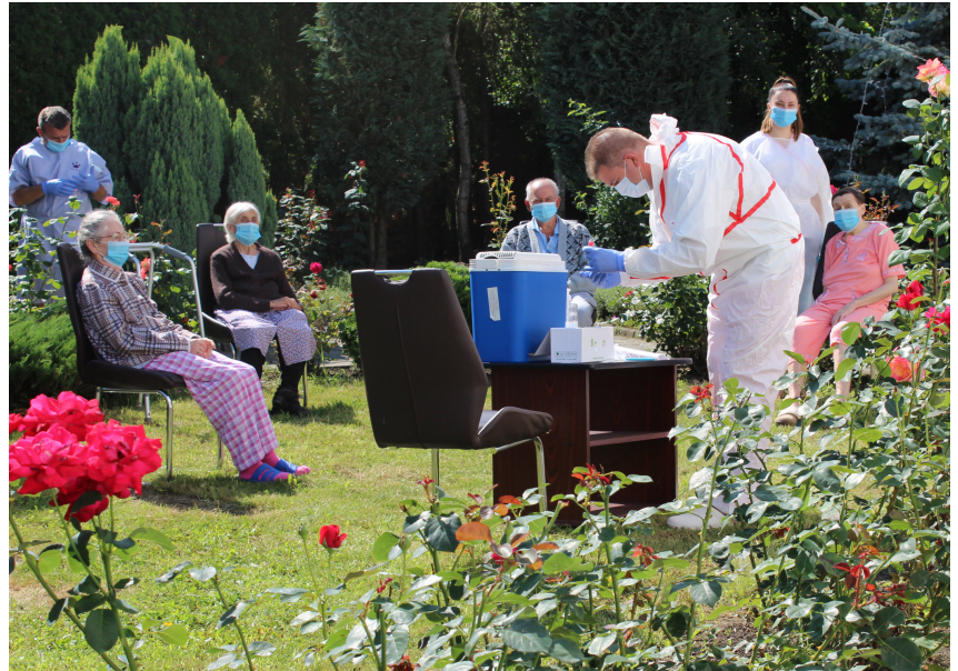
Sommer im Garten des Tageszentrums in Sighisoara: Masken und Tests gehören in Zeiten von Corona zum neuen Alltag.

Zu Beginn der Pandemie im Frühling liess die Zahl der Personen, die sich in Rumänien mit Covid-19 infizierten, noch nicht das Schlimmste befürchten. Verglichen mit anderen Ländern war die Beeinträchtigung durch die Krankheit klein. Das Land bekam die Krise aber nicht in den Griff: Es fehlte an Schutzmassnahmen und Material aller Art. Zudem konnten die schlecht ausgestatteten Spitäler den Erkrankten nicht in ausreichendem Mass Hilfe anbieten. Auch die politischen Querelen im Land waren der Eindämmung der Pandemie nicht dienlich. So stieg die Zahl der Infizierten kontinuierlich. Corona hielt Rumänien, Sighisoara und auch das von uns unterstützte Tages- wie das Nachtzentrum fest im Griff, was verschiedene Anpassungen im Betrieb erforderte.