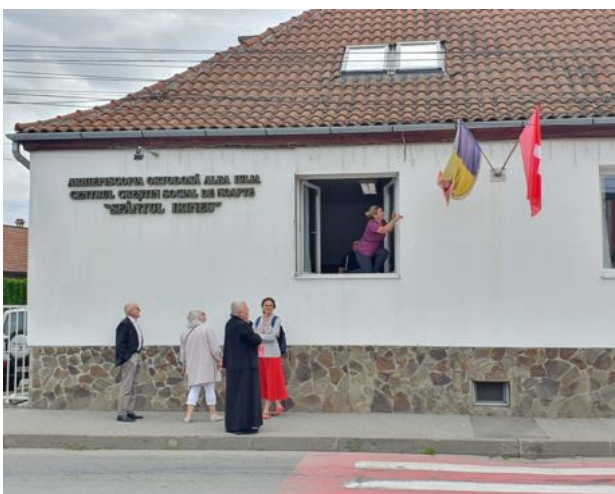
Nachtzentrum in Sighisoara im Mai 2024 mit der Schweizerfahne – Zeichen des Dankes für die Unterstützung durch unseren Verein