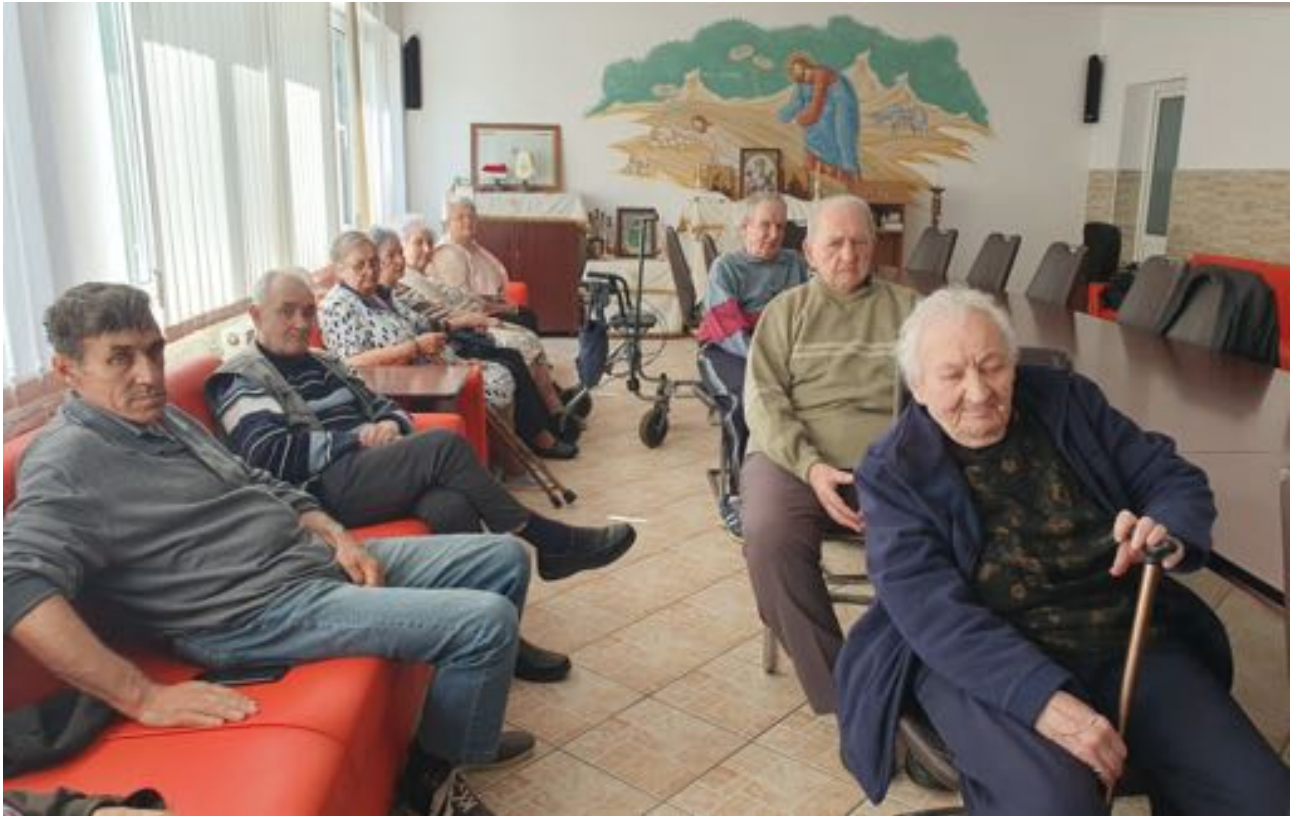
Blick in den Aufenthaltsraum des Zentrums (Mai 2024)