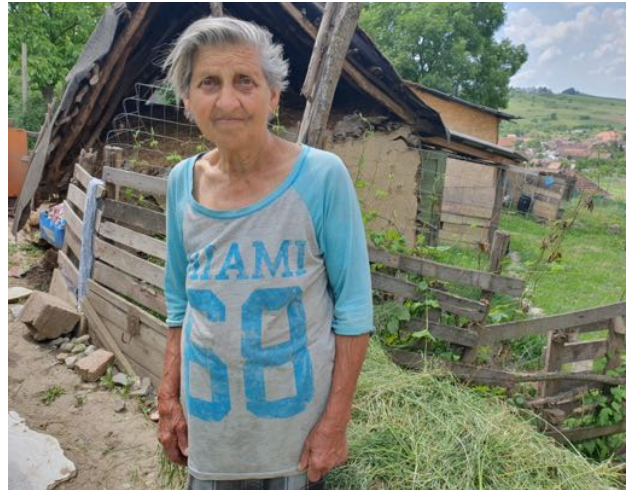
Verarmte Frau in der Pfarrei Boiu erhält Hilfe