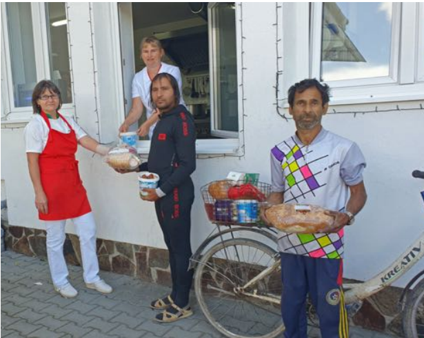
Austeilen von Mahlzeiten an Bedürftige im Tageszentrum in Sighisoara

Dem Vorstand waren auch bei diesem Projektbesuch die Kontakte vor Ort wichtig: Die Arbeitssitzung mit der Zentrumsleitung, an der im persönlichen Austausch die anstehenden Probleme und Zukunftsperspektiven besprochen worden sind, die Besuche im Tageszentrum, bei der Verteilung der Mahlzeiten, in der Pfarrei Boiu sowie der Gottesdienst in der orthodoxen Kirche Corneste in Sighisoara, den wir dieses Jahr bei gutem Wetter zusammen mit vielen Gläubigen im Freien vor der Kirche feiern konnten. Freude bereite auch dieses Mal die «seara festiva», der festliche Abend mit Abendessen, zu dem Pro Sighisoara die Zentrumsleitung, die Leitenden in Boiu wie auch alle Mitarbeitenden des Tages- und Nachtzentrums einlud.